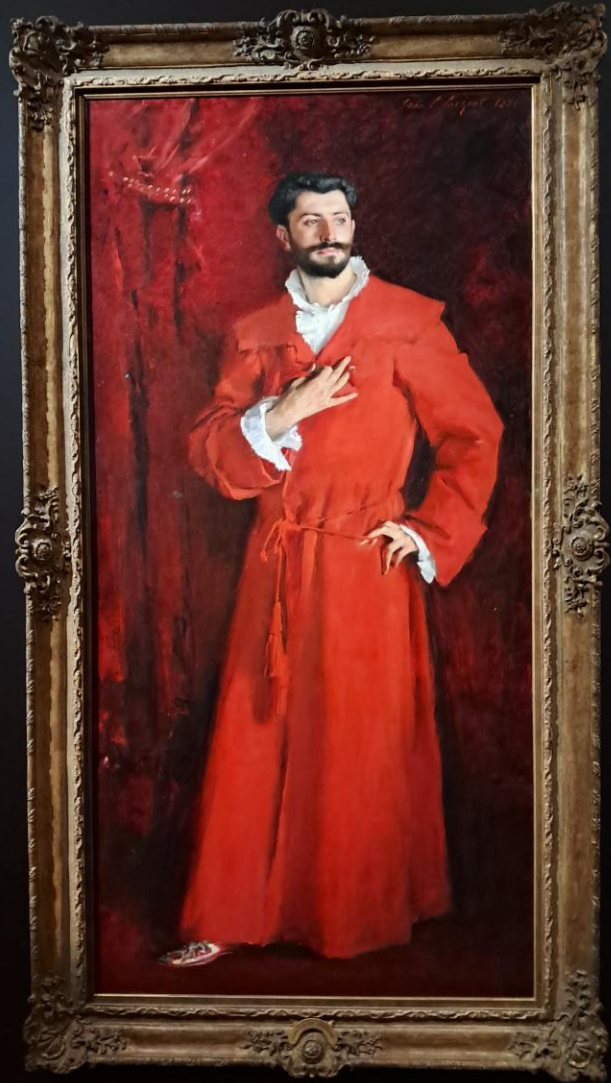
Portrait du Docteur Pozzi Par John Singer Sargent Huile sur toile Dimensions : 201,6 × 102,2 cm