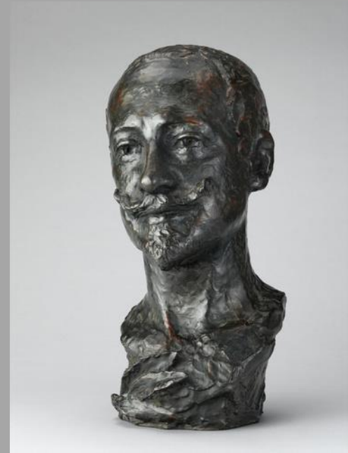
Gabriele d'Annunzio Par Paul Troubetzkoy Sculpteur (1866-1938)