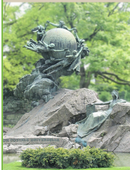
Monument de l'Union Postale Universelle, Bronze 1909 - Berne (Suisse)